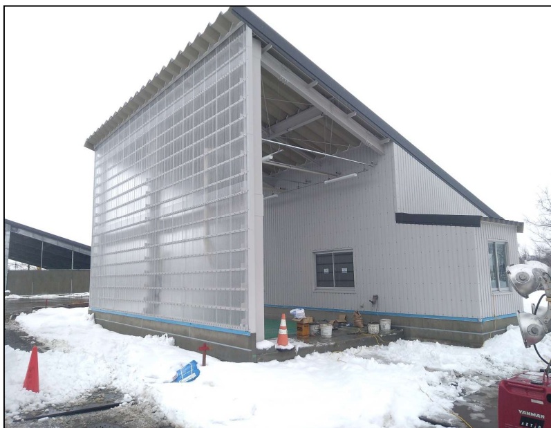
12.27現在 現況写真 事務所棟 北西側より ..... ..... ..... ..... ..... .....