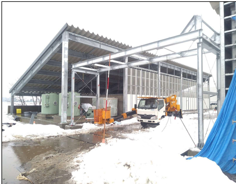
12.27現在 現況写真 生物脱臭棟 南東側より ..... ..... ..... ..... ..... .....