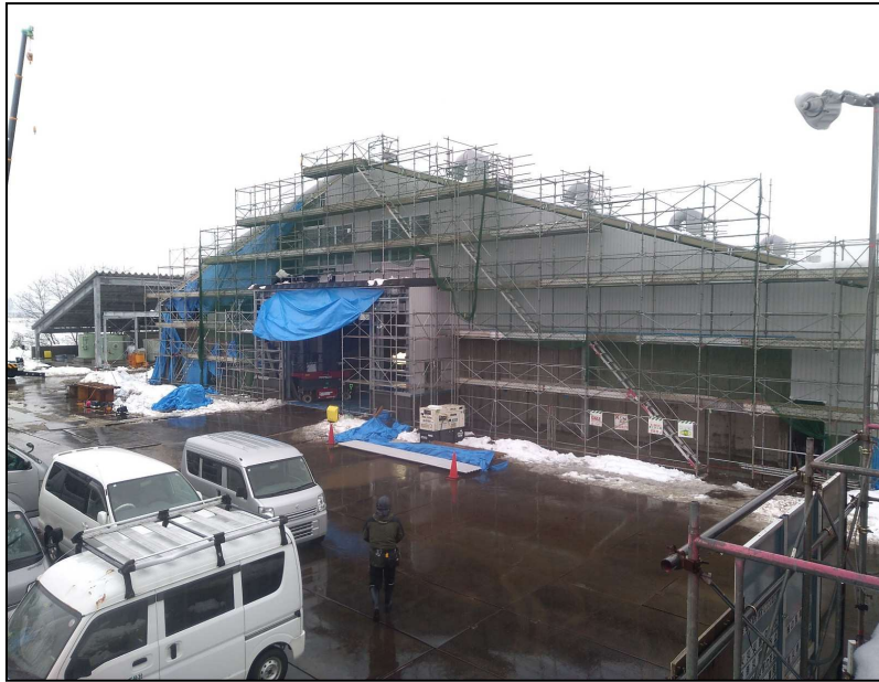
12.27現在 現況写真 汚泥資源化棟 南東側より ..... ..... ..... ..... ..... .....